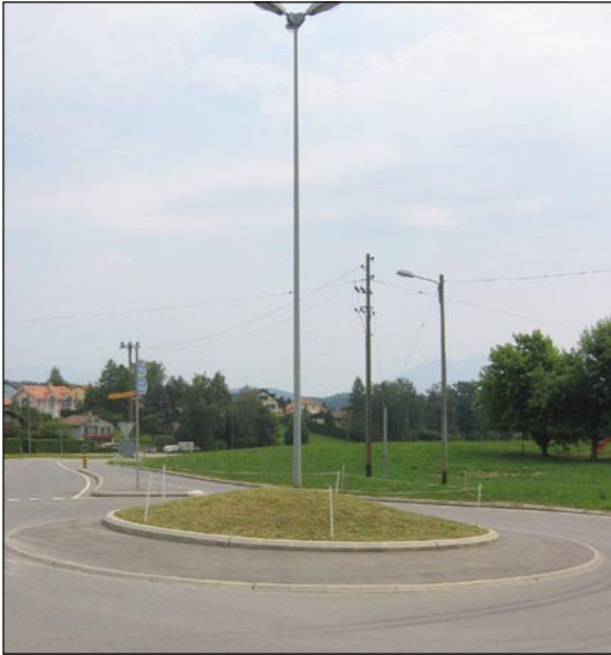
Giratoire traité en « prairie maigre » nécessitant un très faible entretien.