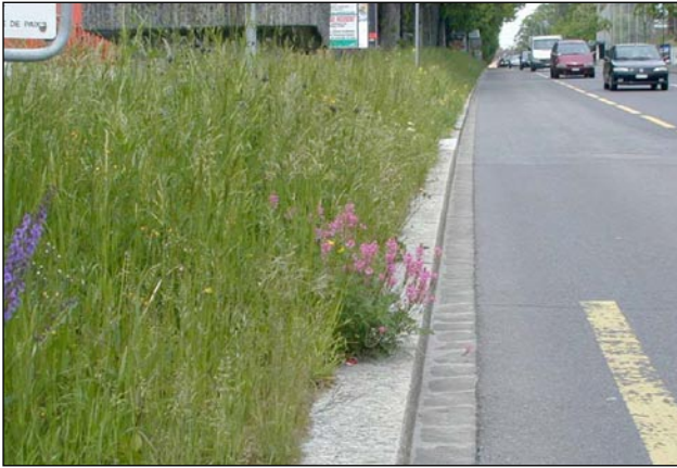
Les bermes routières se prêtent bien au traitement en prairie.

Avec 127 000 habitants et 350 hectares d'espaces verts, la ville de Lausanne est, en importance, la 5e ville de Suisse. De par sa situation géographique, Lausanne est située au carrefour des grandes communications européennes mais elle est également le point de rencontre des espèces végétales d'origine nord-européenne et méditerranéenne ce qui lui confère une biodiversité floristique particulièrement riche.