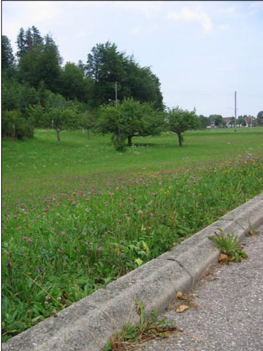
Les espaces interstitiels de moindre fréquentation ne nécessitent pas un entretien intensif.